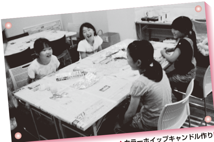
▲カラーホイップキャンドル作り