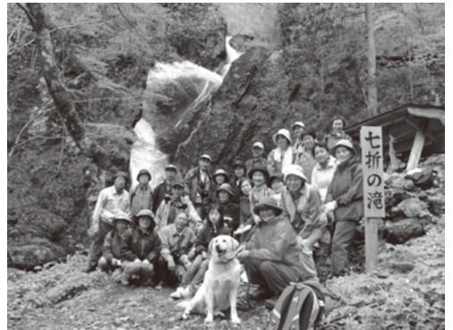
七折りの滝 2014年5月18日