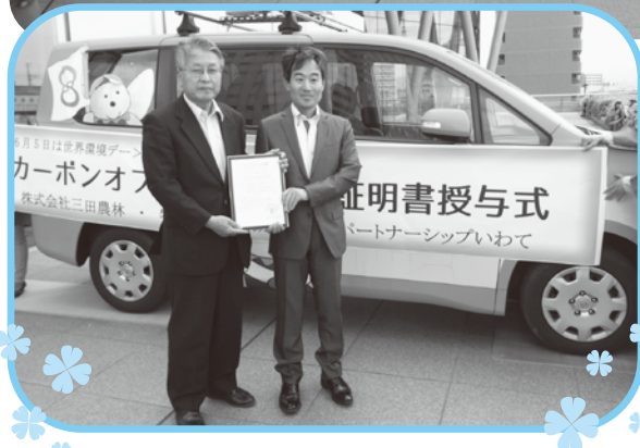
県環境学習広報車「エコカーゴ」の カーボンオフセット※ 無効化証明書授与式（6月5日）

平成26年度がスタートし、約4ヶ月が経ちました。今年度も、様々な分野で活動されている団体や事業所の皆様と連携させていただきながら、企画展示や環境学習講座などの事業を展開していきたいと考えています。また、県内各地でイベントや学習会に参加し、環境の輪を広げていく活動ができれば…と思います。引き続きご支援のほどよろしくお願いたします。