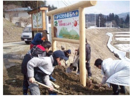
子ども達による森林環境税PR看板づくり作業の様子

網代滝周辺の道路(林道)および支流河川などの草刈や清掃活動、総合学習(水生生物調査)の水質調査及び水棲生物調査への協力や、子ども達と里山の自然体験活動を行っている。