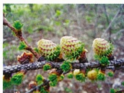
カラマツの芽吹き (5月初旬)

この道はいつも何気なく通過していると思いますが実はこの並木を陰で守っている人たちがいます。それが「巢子の森を語る広場」のみなさんです。今回は、この団体の活動とここに生息する植物とかわいい動物を紹介します。