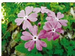
サクラソウ (5月初旬)