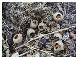
アカネズミの食べ跡オニグルミ