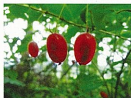
ウグイスカグラの実 (7月)