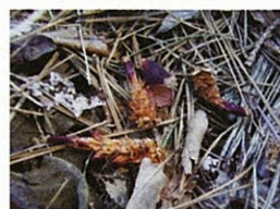
森の海老フライ (リスの食べ跡)

この並木の中には散策のできるコースがあります。岩手牧場の入り口から果樹研究所前までと、巢子の信号付近の2区間です。牧草地と秀麗な岩手山が調和した雄大な景観を楽しむことができ、日本風景街道に登録されています。