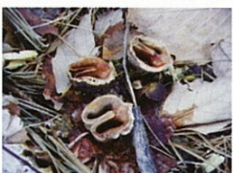
リスの食べ跡オニグルミ