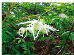
キバナイカリソウ (5月中旬)